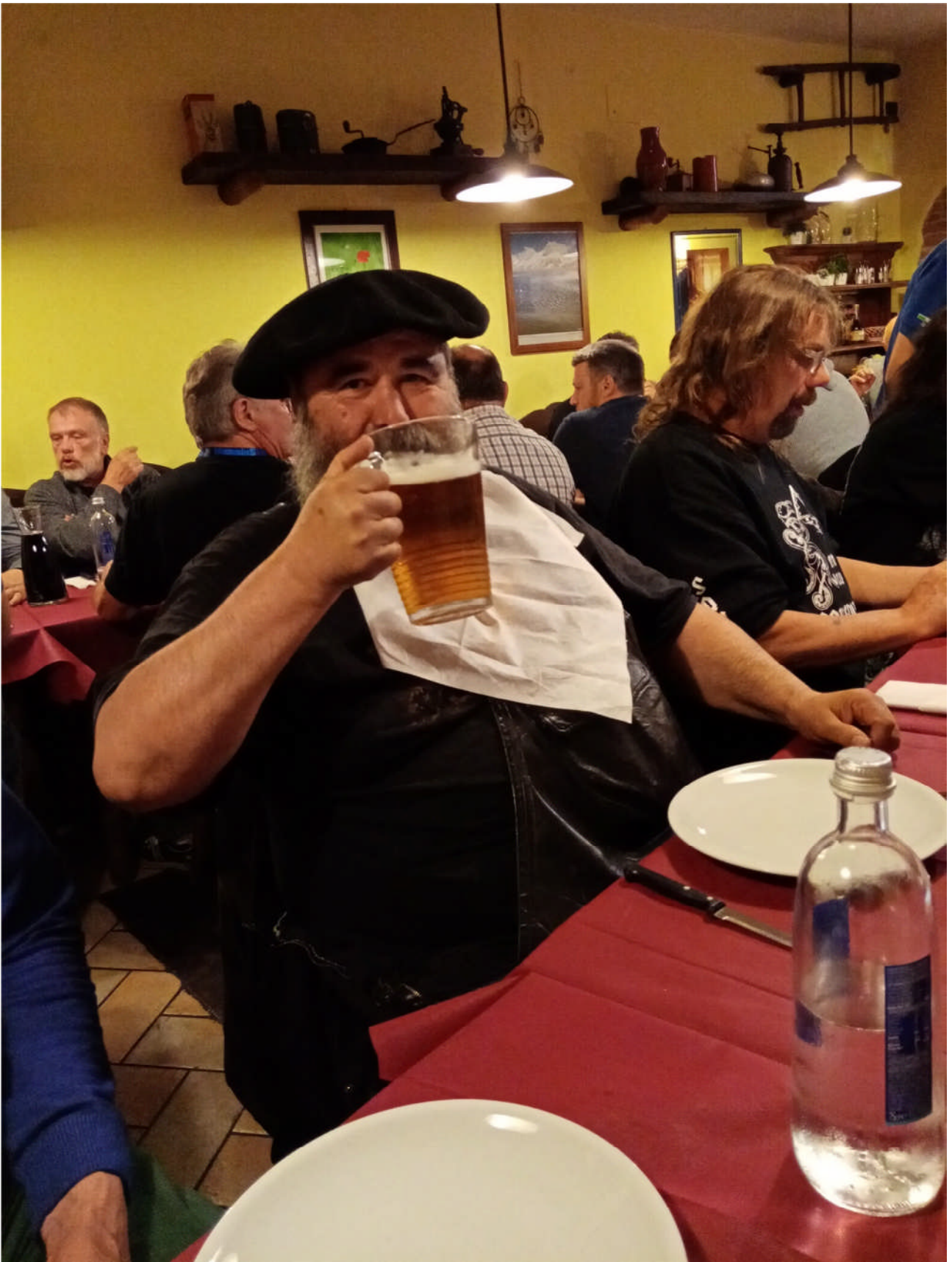
Et pour finir , rappel du Quarté 2020 pour les « Nouveaux Copains »